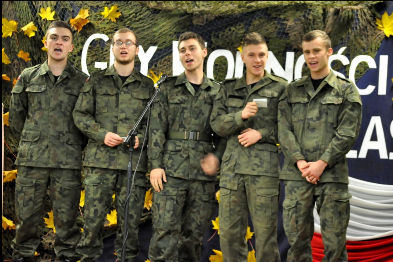
Konkurs pieśni patriotycznej

Podczas obchodów różnych świąt organizowane są konkursy tematyczne. Podczas obchodów Narodowego Święta Niepodległości odbywa się konkurs pieśni patriotycznej, a w okresie świąt Bożego Narodzenia konkurs na najpiękniej nakryty stół