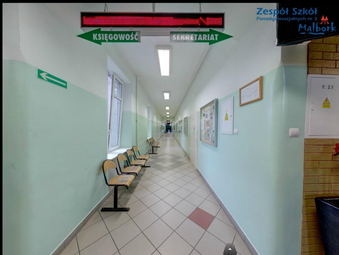
Korytarz na parterze

ZSP nr 3 jest nowoczesną i zadbaną placówką. Świadczą o tym: nowoczesne sale, zadbane korytarze. Zamiast tradycyjnych papierowych dzienników, używany jest dziennik elektroniczny. Budynek placówki posiadają rozbudowaną sieć informatyczną.