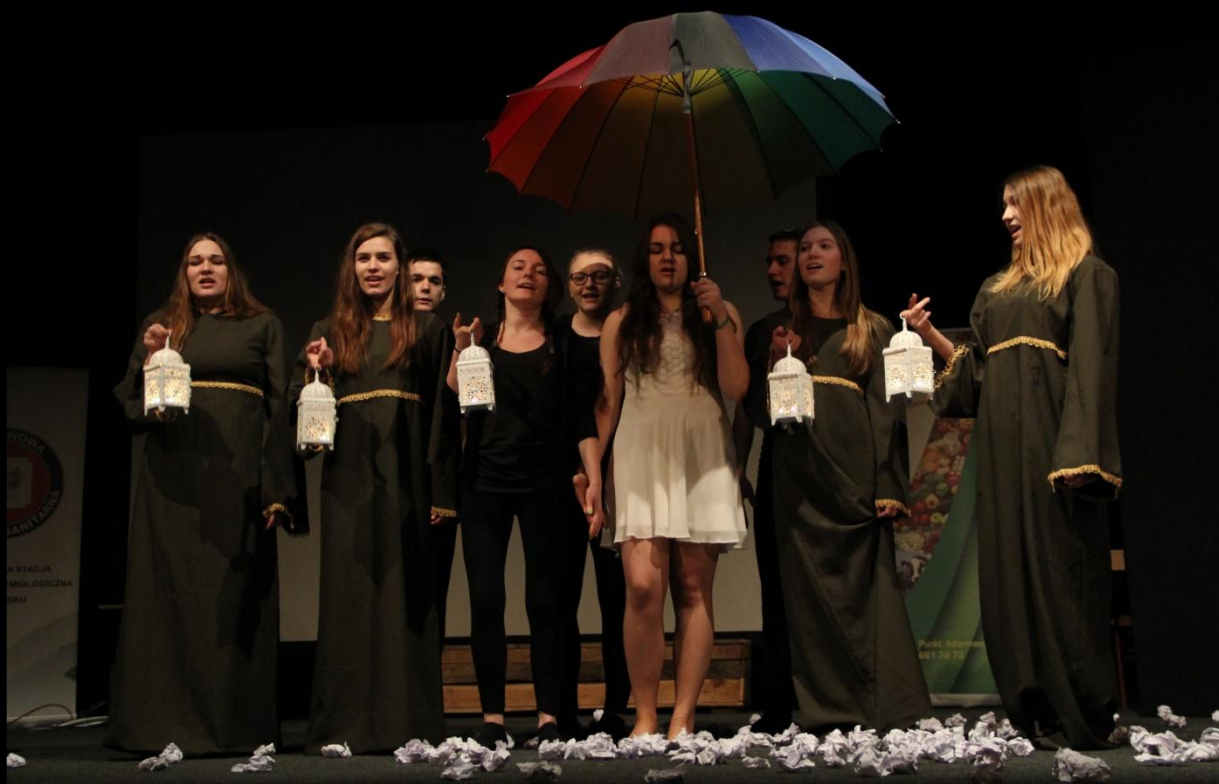
Zdjęcie z autorskiego spektaklu koła teatralnego

Szkoła posiada również prężnie działające koło teatralne które odnosi spore sukcesy. 14 stycznia 2015 roku grupa zdobyła drugie miejsce podczas Wojewódzkiego Przeglądu Małych Form Teatralnych "Uzależnienia wokół nas".