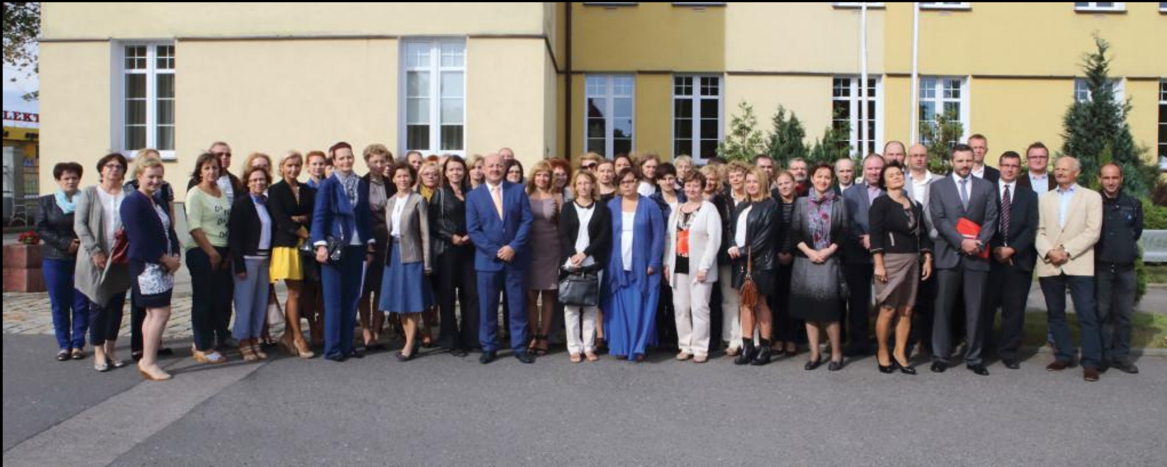
Grono pedagogiczne ZSP nr 3

Szkoła posiada wykwalifikowaną kadrę pracowniczą składającą się z 75 pracowników, w tym 63 nauczycieli.