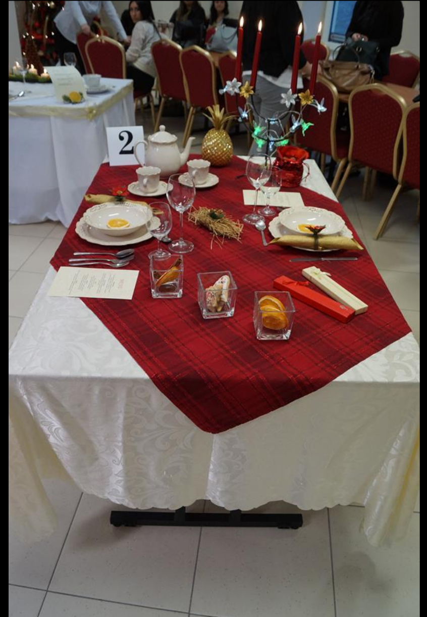
Konkurs na najpiękniej nakryty stół