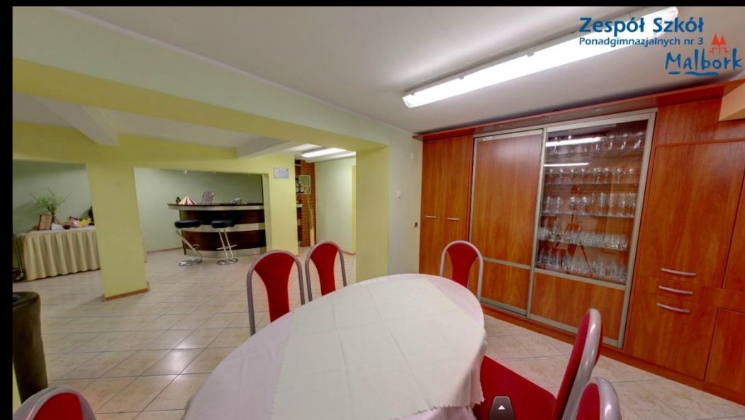
Pracownia obsługi konsumenta