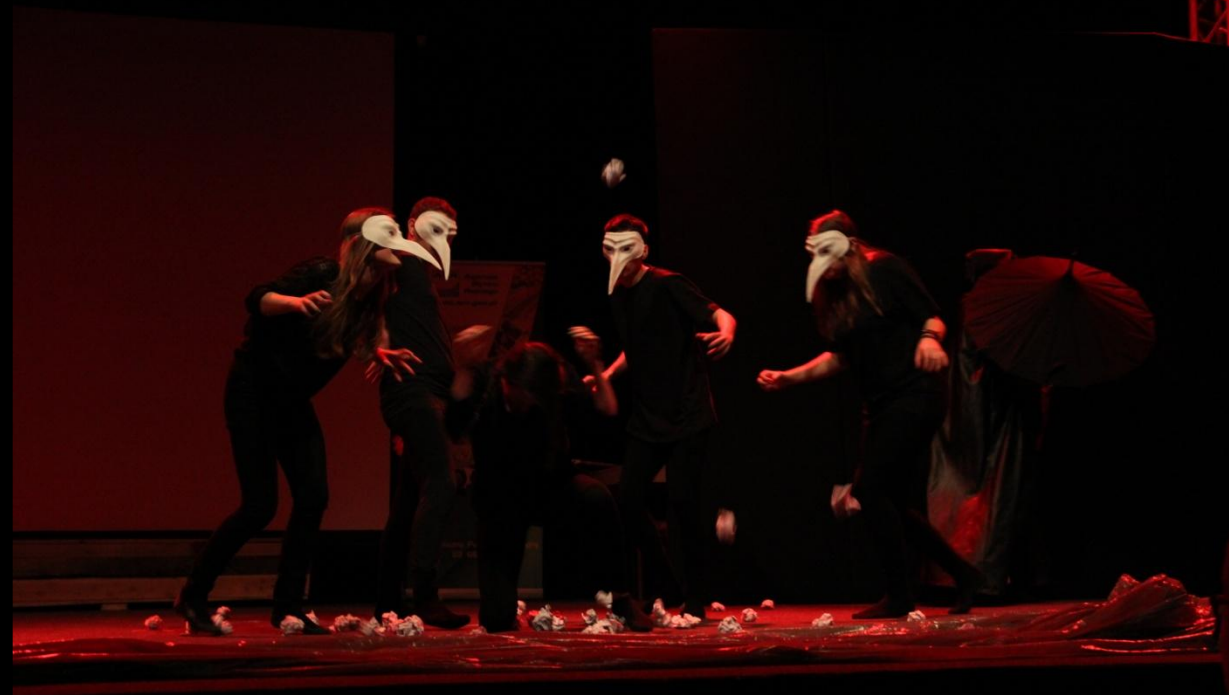
Zdjęcie z autorskiego spektaklu koła teatralnego