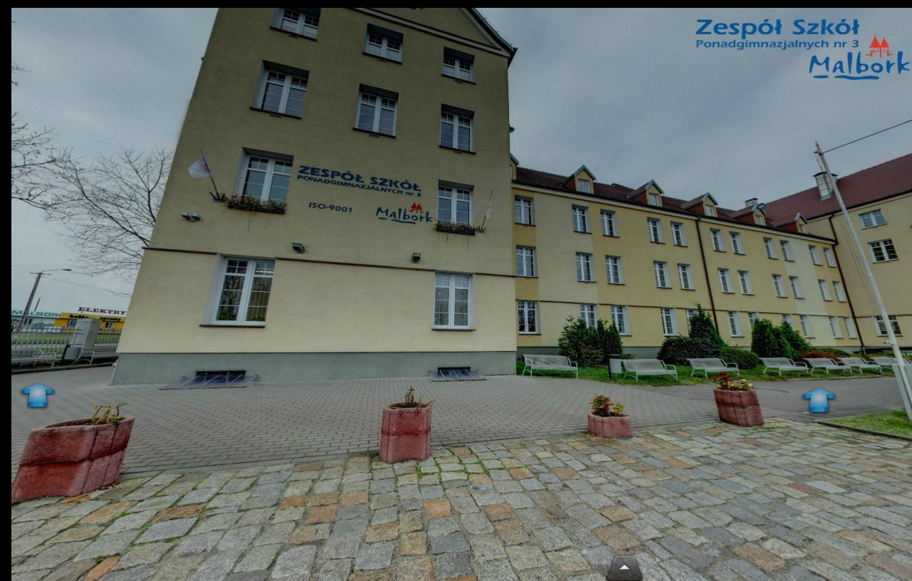
Główny budynek szkoły