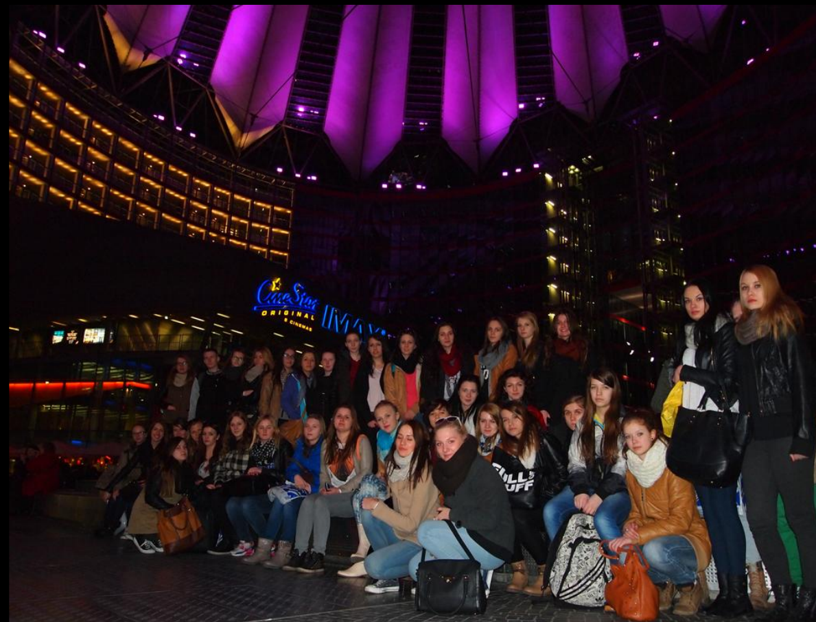
Uczniowie ZSP nr3 na targach turystycznych ITB w Berlinie